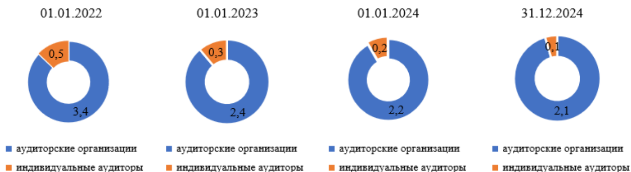
Рис. 2. Динамика количества аудиторских организаций и индивидуальных аудиторов в Российской Федерации (составлено авторами на основе [4])

Согласно данным Министерства финансов РФ, в 2022–2025 годах продолжилась тенденция сокращения числа участников аудиторского рынка, что продемонстрировано на рис. 2.