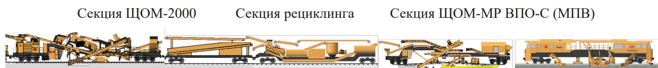
Рис. 2. Комплекс для устройства подбалластного защитного слоя