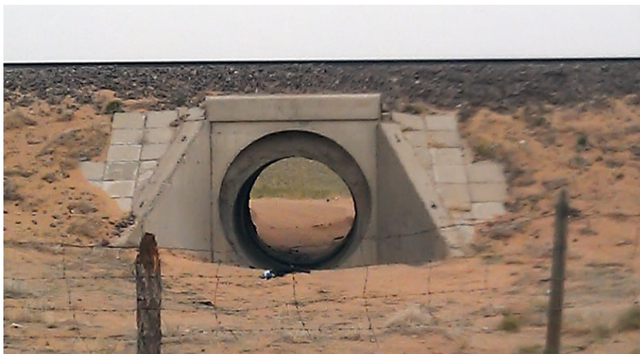
Рис. 2. Круглая сборная железобетонная труба с отверстием 1,5 м на участке Нартын Хошуу — Шаргын Овоо Улан-Баторской железной дороги