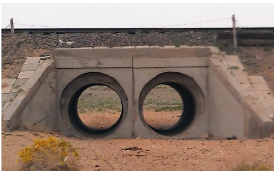
Рис. 3. Круглая сборная железобетонная труба с отверстием 2 \times 1,25 м на участке Нартын Хошуу — Шаргын Овоо Улан-Баторской железной дороги

Для того чтобы решить эту вероятную проблему, разработано множество практических решений, к которым относятся прежде всего отсыпка переменной толщины грунтов улучшенных свойств в теле земляного полотна и использование современных конструкций и материалов, которые хорошо себя зарекомендовали на аналогичных участках транспортных магистралей различных стран мира [7, 8, 9, 10].