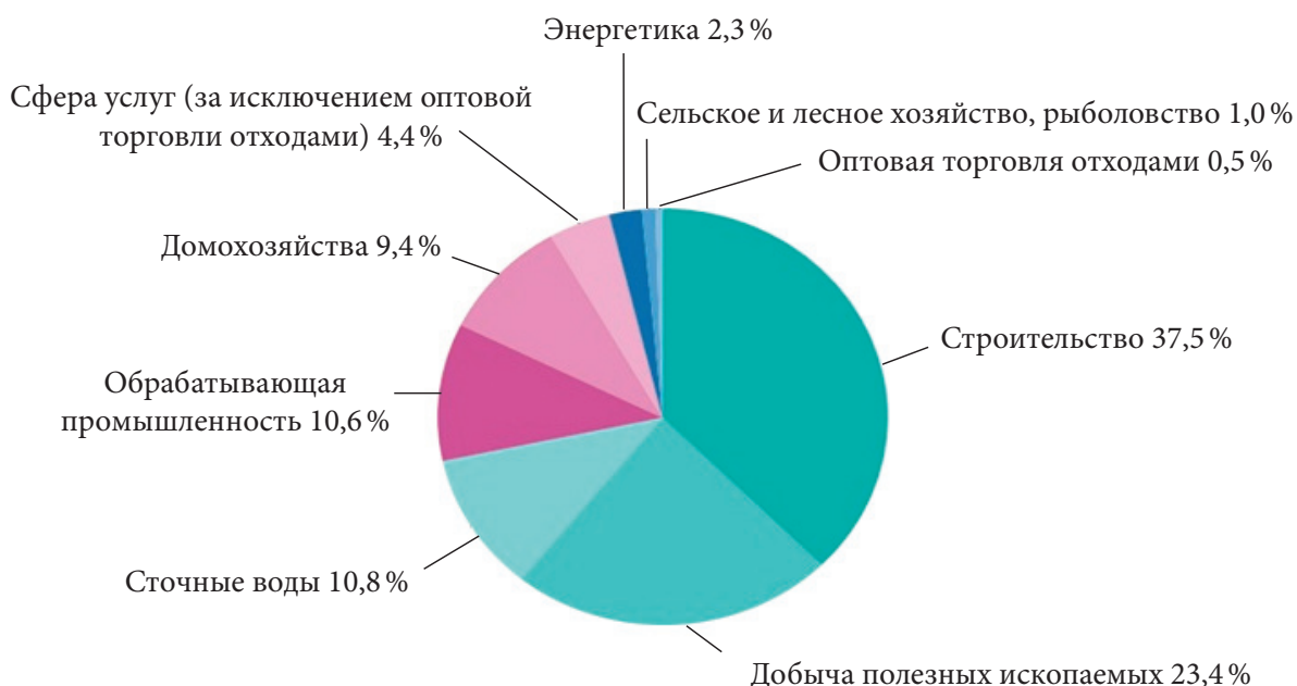
Рис. 1. Образование отходов в странах Евросоюза по видам экономической деятельности, по данным за 2020 год [3]

Ежегодно в мире образуется огромное количество техногенных отходов. Согласно официальному сайту Евростата [3], в результате всех видов экономической деятельности в странах Евросоюза в 2020 году образовалось 2135 млн т отходов. Наибольший объем приходится на строительство и добычу полезных ископаемых (рис. 1).