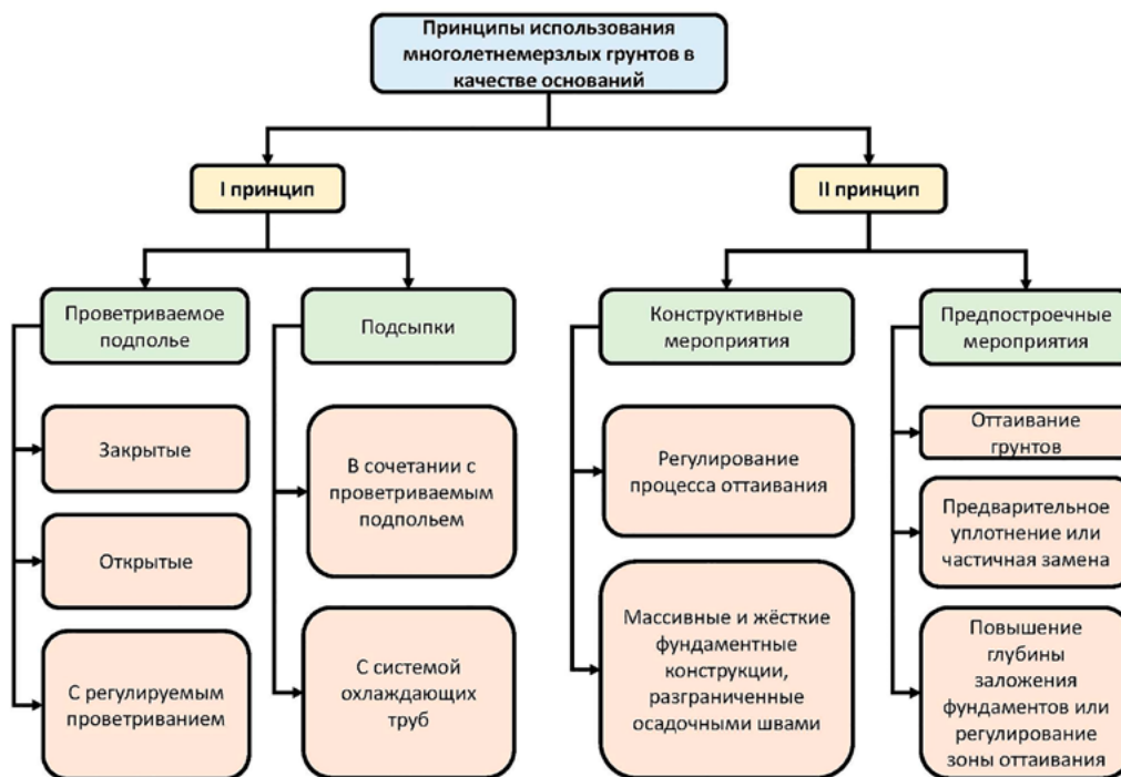
Рис. 3. Принципы использования ММГ в качестве оснований

Серии жилых крупнопанельных зданий для северных районов с сейсмической активностью