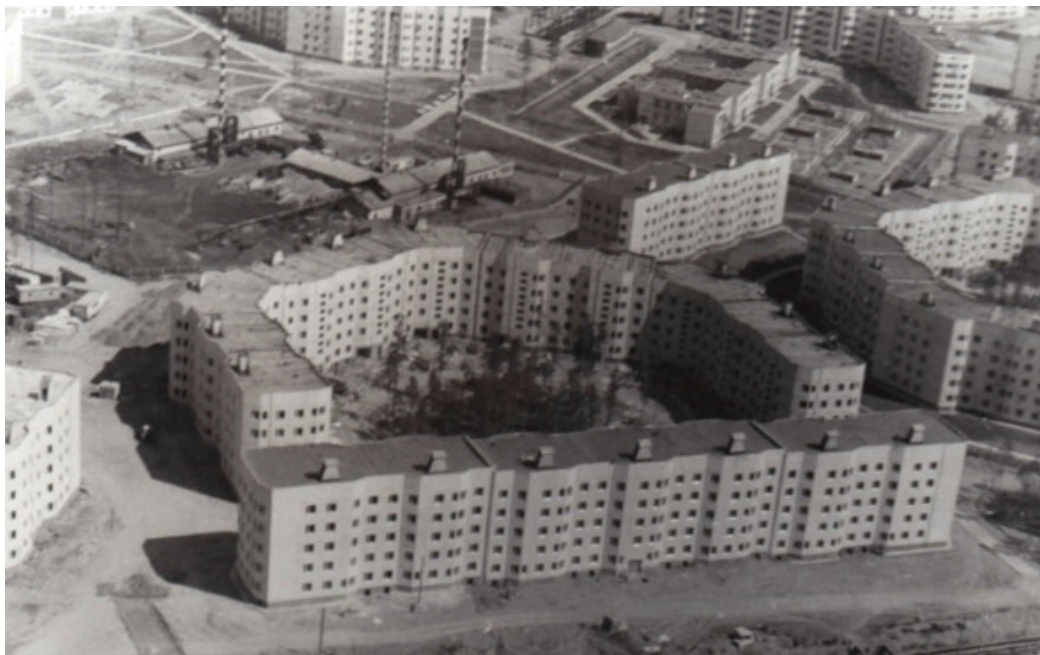
Рис. 4. Аэрофотосъемка жилых домов 122 серии в г. Северобайкальске [27, с. 25]

зависимости от принципа строительства, а также сейсмичности площадки строительства. Наиболее распространенные серии и их отличительные особенности представлены в таблице.